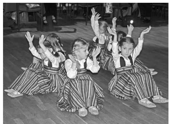
Bērnu deju kolektīvs.

Paldies visiem pašdarbības kolektīviem un to vadītājiem! Kā pateicību viņi saņēma dāvanas - saldumu paciņas, konfektes ar Ērgļu saieta nama logo un lielo svētku klišēri - 2018! Savie-