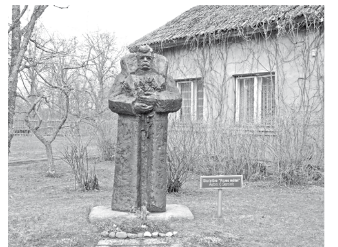
Neilgi pirms Ziemassvētkiem tēlnieks O. Skarainis aizgāja mūžībā. Šis fotoattēls lai ir kā atvadu sveiciens māksliniekam. Tēlnieka Oļega Skaraiņa veidotā skulptūra “Rozes māte” “Braku” muzejā.

2018. gads ir zīmīgs Latvijas vēsturē, un tas tiek plaši gatavots visas valsts mērogā. Bet savu artavu Latvijas simtgadei ir