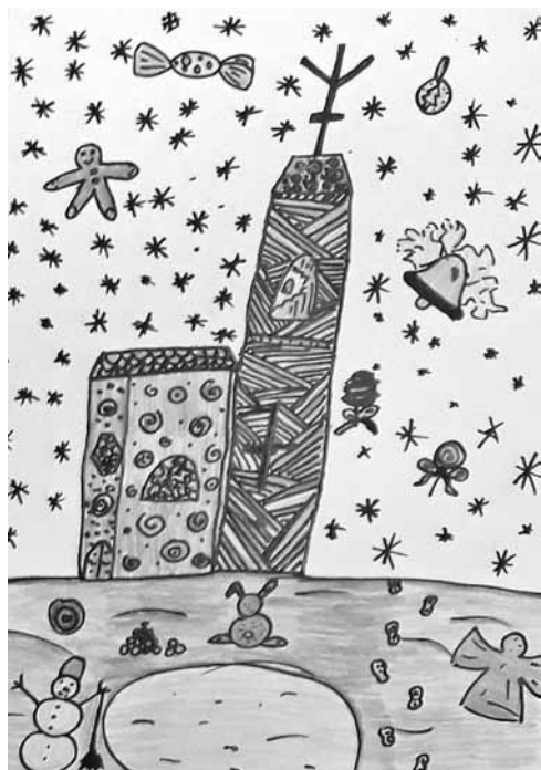
Liene Feldberga EMMS 2. kurss