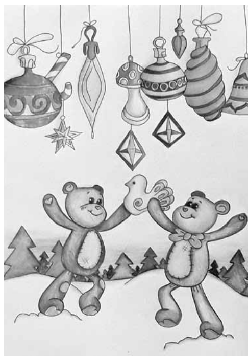
Signe Solovjeva EMMS 5. kurss