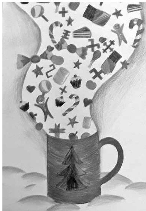
Eliza Madsena EMMS 5. kurss