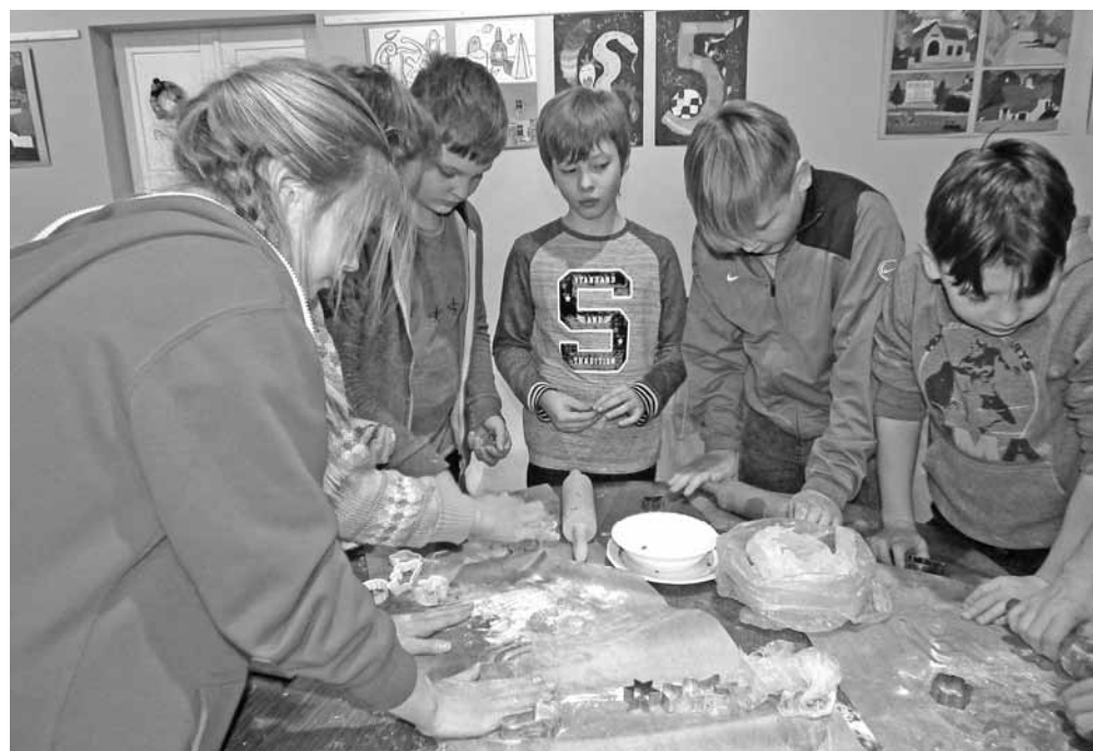
5. klases pīparkūku meistari.

Otrdien, 19. decembrī, Ērgļu vidusskolā notika pīparkūku cepšanas pasākums. Katram skolēnam, kurš vēlējas piedalīties, vajadzēja atnest 0,50 centus klases domniekam. Garajā starpbrīdī plkst.12.00 skolēni taisīja pīparkūkas un salika uz pannām, ko vēlāk likām mājturības kabinetā krāsnī. Drīz vien skola piepildījās ar pīparkūku smaržu. Vēlāk, uz vakarpusi, plkst.16.00 varēja nākt skatīties filmu un ēst pašu izceptās pīparkūkas. Filmu „Lampiņu drudzis” bija sarūpējis Kristaps Gūts.