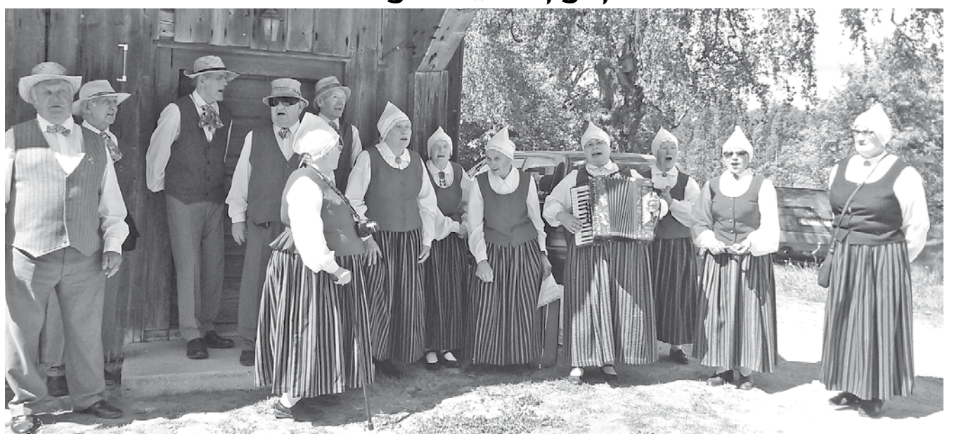
Tautas mūzikas kopa „Pulgosnieši” „Meņģeļos” 2017. gada jūnijā.

Septembra otrajā sestdienā organizējam Pirts dienu, kur zināša-