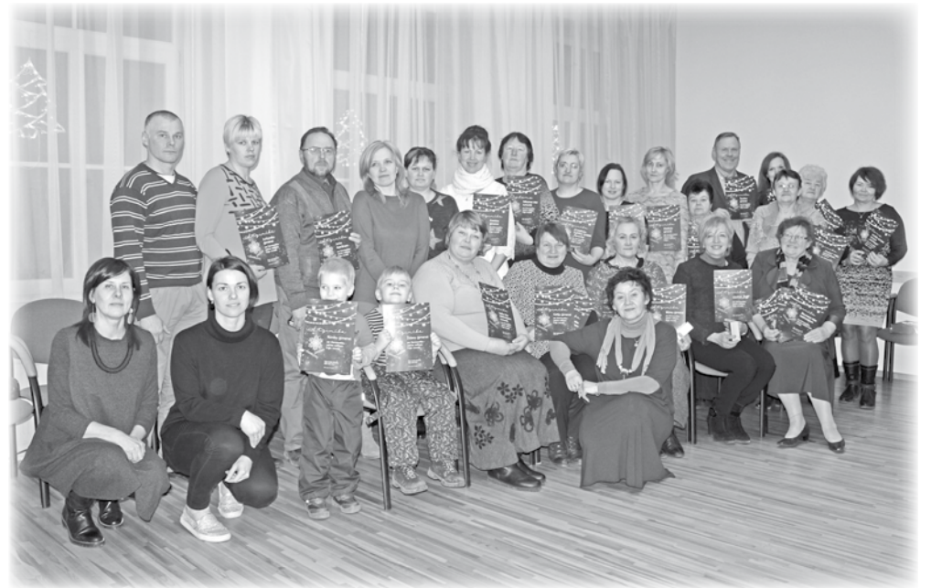
Konkursa dalībnieki un žūrija noslēguma pasākumā.

Aizvadītā gada nogalē Ērģļu novada pašvaldība sadarbībā ar Ērģļu saietu namu organizēja Ziemassvētku noformējumu konkursu "Ziemassvētku mirdzums". Konkursa mērķis bija veicināt iedzīvotāju līdzdalību Ziemassvētku un Jaunā gada noskaņas radīšanā Ērģļu novadā. Konkursam no 4. līdz 18. decembrim varēja pieteikties juridiskas vai fiziskas personas ar Ziemassvētku noformējumu novada iestāžu, uzņēmumu un sabiedriskajām ēkām, kā arī privātmāju un daudzstāvu dzīvojamu māju fasādēm un priekšlaukumiem. Noformējumi tika vērtēti trīs kategorijās: privātmāju, uzņēmumu un dzīvokļu māju vai ielu noformējums.