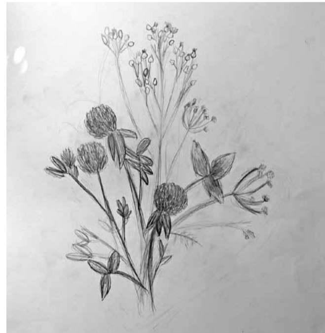
Evelīna Estere Jansone ĒMMS 4. kurss