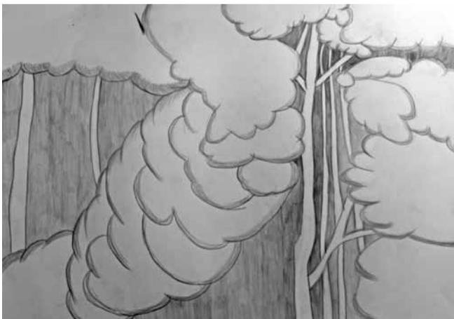
Emīlija Grīnberga ĒMMS 4. kurss

Bērzs miegaini jautāja: "Kas noticis, mazo, nepazīstamo kastanītī?"