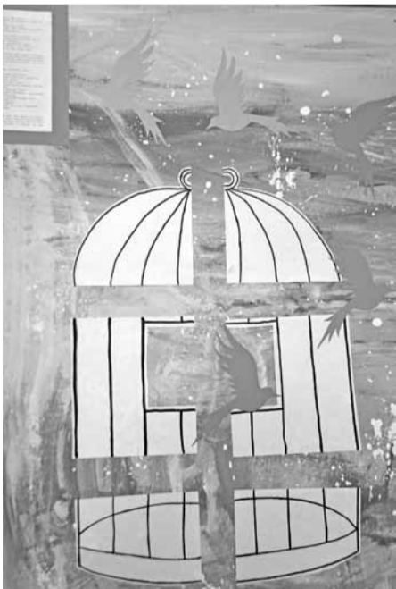
11. klases kolāža dziesmai „Rudens”.

Putns ir ļoti kluss, tādēļ uzmanību es tam pievēršu maz. Ir brī-