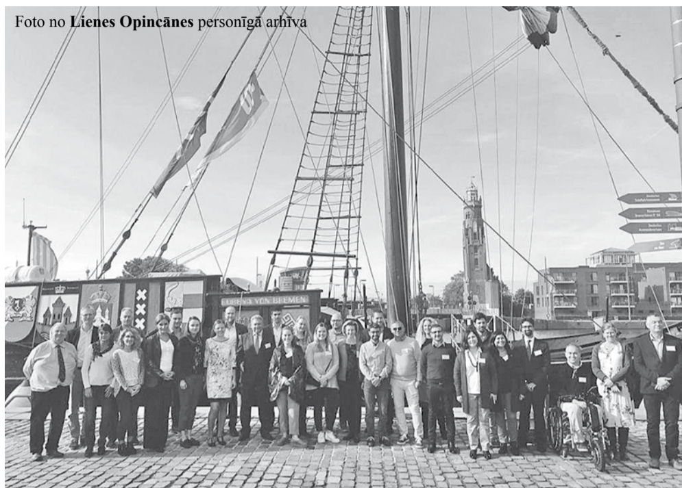
Darba grupas dalībnieki.