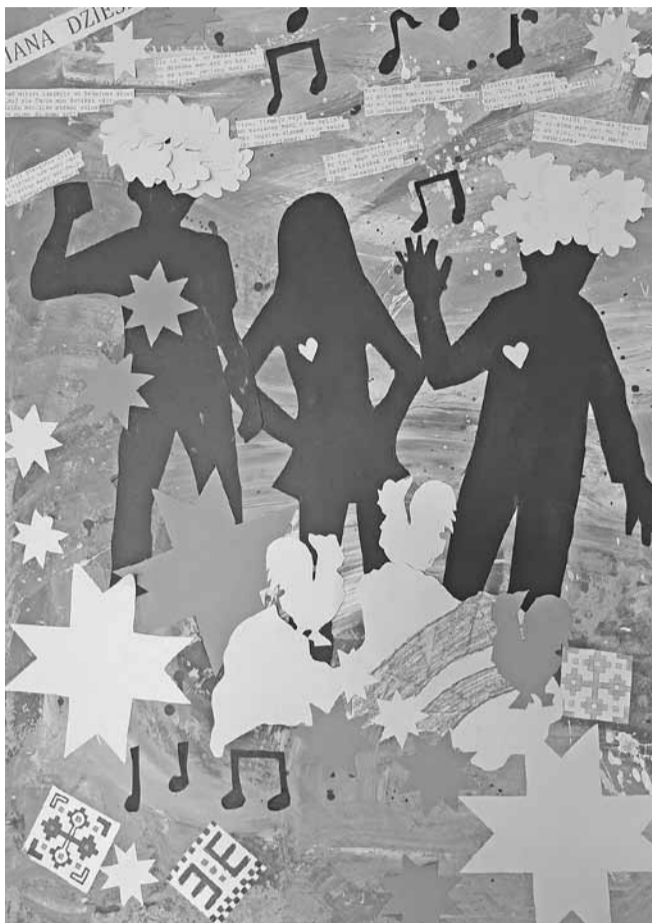
2. klases kolāža dziesmai „Mana dziesma”.

Reiz mazā Luīze sapņoja, ka viņai būs sapņu princis balta zirgā, un vienmēr savus sapņus uzticēja savam labākajam draugam Deividam, jo pārējie Luīzi sauca par gaisa grābsli, bet viņš nē. Un jūs noteikti domājat - kāpēc? Deivids arī bija sapņotājs un meklēja savu princesi. Tā viņi vienmēr sapņoja kopā.