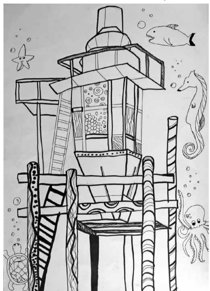
Liene Feldberga ĒMMS 3. kurss