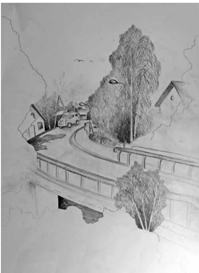
Santa Kalniņa ĒMMS 5. kurss

Ātri atbrīvojot no atkritumiem un devos pacelt zemē guļošo lapu. Tā kā kastaņi savā starpā bija tik draudzīgi, bet lapa kautrīga un bikla, es tai ierādīju jaunu vietu - otro plauktu