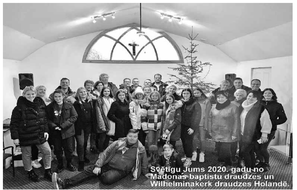
Svētīgu Jums 2020. gadu no Madonas baptistu draudzes un Wilhelminakerk draudzes Holandē.

Jau 14 gadus pēc kārtas grupa no Wilhelminakerk draudzes Holandē brauc uz Latviju, Madonu, lai iepriecinātu tos, kas ir trūcīgā, dāvājot pārtikas paku, savu laiku, runājot un uzklauso, bet caur to visu dāvājot mīlestību. Pēc aktīvi pavadītajām dienām, apciemojot cilvēkus, pansionātus un bērnu namus, ar lielu prieku atgriežamies pie mūsu draugiem "Zīluka", lai arī šajā laikā viņus iepriecinātu. Mums ir patīams prieks par šo draudzību, kas ir izveidojusies starp ģimenes atbalsta centru "Zīluka", Madonas baptistu draudzi un Holandes draudzi. Ir patīkami redzēt nevilto prieku bērnu acīs par ciemiņu ierašanos un pavadīto laiku kopā. Draugi no Holandes bija sagatavojuši nelielu teātra uzvedumu, ko arī kopā vērojām ar bērniem un pēc tam pārrunājām redzēto. Protams, bez spēlēm un jautrības arī neiztik. Pa visu šo laiku, ko pavadījām kopā, ir jauki redzēt, kā šī draudzība turpinās vairāku gadu garumā un valodas barjera tai nav šķērslis. Wilhelminakerk draudze ar lielāko prieku savāc ziedojumus, lai kaut nedaudz spētu palīdzēt "Zīluka" draugiem iegādāties nepieciešamās lietas. Protams, bērni bez saldumu paciņām un mazām dāvanām arī neiztika. Pēc brīnišķīgi pavadītā laika visi bija piepildīti ar pozitīvisma devu un mīlestību. Esam pateicīgi par šo draudzību, kas jau turpinās vairāku gadu garumā.