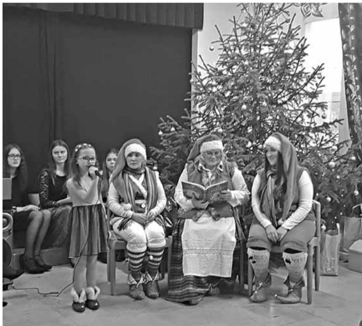
Labdarības biedrības "SirdsDarbs rūku darbnīca" pasākums.

Klāt jauns gads. To mēs katrs sākam ar jaunām cerībām, sapņiem un apņemšanos. Taču, pirms uzsākam jaunu dzīves posmu, domās vēl pārcilājam iepriekšējā gada priecīgos notikumus, veiksmes, neveiksmes un gūtās dzīves mācības, lai ar jauniem spēkiem sāktu rakstīt jau citas nākamā dzīves gada lapas.