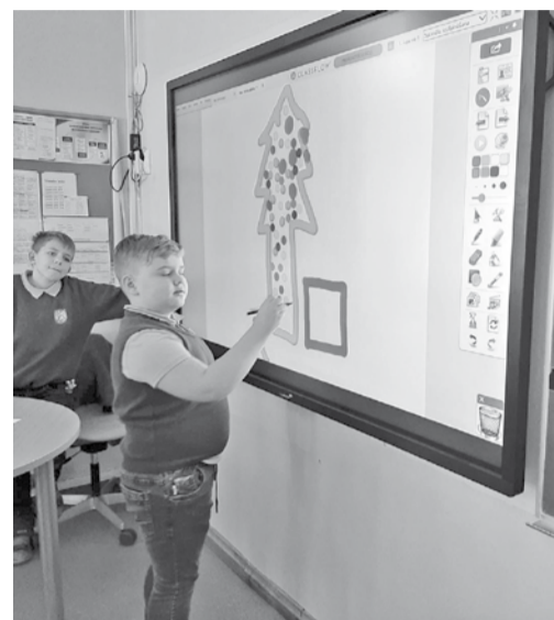
Niks turpina klasesbiedru iesāktu Ziemassvētku zīmējumu.

Mūsdienās ir pieejami ļoti dažādi un kvalitatīvi mācību materiāli, kurus iespējams izmantot, ja pieejama interaktīvā tāfele. Tā piesaista mūsdienu skolēnu uzmanību, veicinot viņu aktīvu darbošanos, uz sadarbību orientētu mācību procesu. Šīs prasmes uzsvērtas arī jaunajā izglītības standartā. Šogad iespēju izmantot aktīvāk modernās tehnoloģijas ieguvusi arī 3. klase un viņu skolotāja.