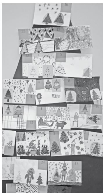
Bērnu veidotais Adventes kalendārs.