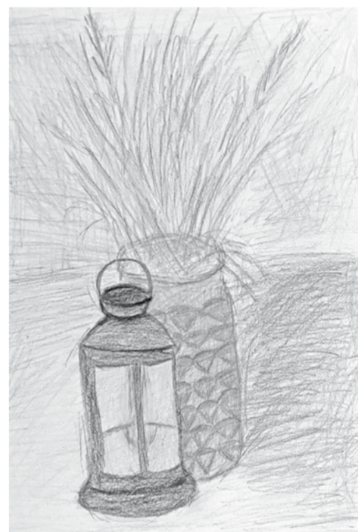
Katrīna Rešņa, 10. klases skolniece