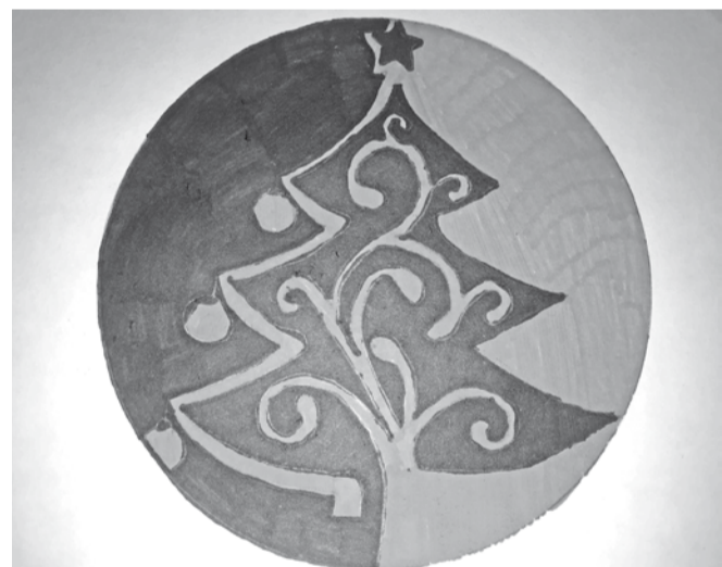
Agnija Trimpele, 8. klases skolniece

Siltas, ģimeniskas attiecības ir parādītas starp Pičuku un Aucī. Te sajūtamas rūpes, mīlestība vienam pret otru un pret