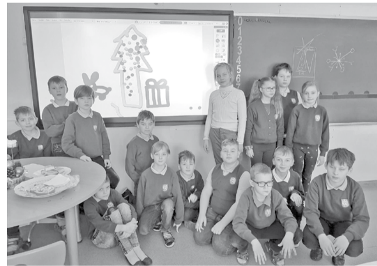
Priecīgā 3. klase pie kopīgi paveiktā darba.

Interaktīvā tāfele ir liels skārienekrāns, ko izmanto kopā ar datoru. Uz tās var strādāt ar visām programmām kā uz milzīga datorekrāna. Īpaša programmatūra paplašina lietotāju iespējas no parastās zīmēšanas un rakstīšanas uz virtuālās virsmas līdz informācijas un internetā atrodamo objektu pievienošanai, prezentāciju izveidošanai, eksperimentu demonstrēšanai. Tāfelei ir ļoti laba izšķirtspēja, tāpēc attēli un video ir redzami kā ļoti kvalitatīvi attēli. Ar jauno ierīci var strādāt gan skolēni, gan skolotāja. Īpaši vērtīga interaktīvā tāfele ir arī tāpēc, ka pēc jaunajam epidemioloģiskajam prasībām klase strādā divās telpās, bet, izmantojot zoom vidi, 2. grupa redz, ko skolotājs rāda, raksta, zīmē, demonstrē uz tāfeles. Jaunās ierīces iespējas izmantot mācāmiens visi - gan skolēni, gan skolotāji.