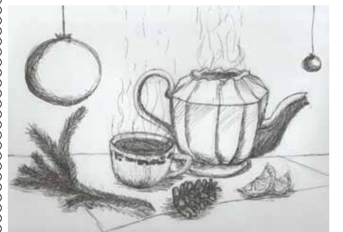
Ērgļu MMS 5. kursa audzēknes Patrīcijas Dreiblates zīmējums.

Ērgļu Mākslas un mūzikas skola visiem novēl veselību, mieru un gaišu prātu.