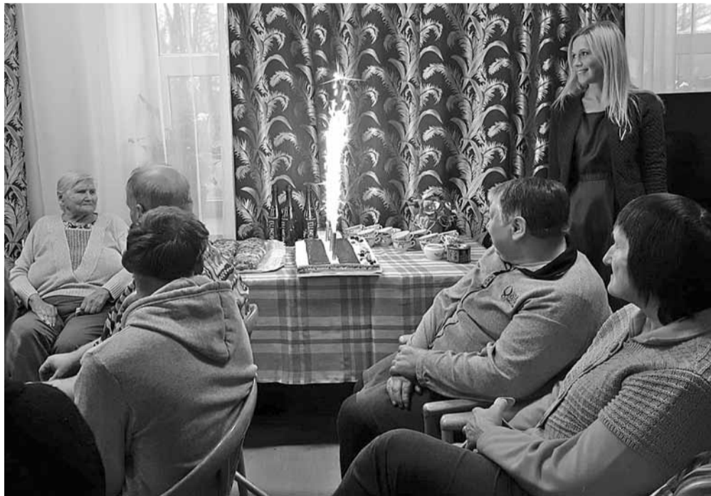
Novembra svētku torte.

Jau atkal klāt rudens ar dienām bez saules un tumšiem vakariem. Jo tumšākas dienas, jo vairāk gaismas mums pašiem jāatrod savās sirdīs. Jo īpaši šajā laikā, kad apkārt valda satraukums un neziņa. Sociālās aprūpes centra “Kastaņas” iemītnieki savu ikdienu aizvada, rosīgi darbojoties, piedaloties dažādās aktivitātēs, attālināti sazinoties ar sev tuvajiem cilvēkiem un cerot uz drīzu satikšanos.