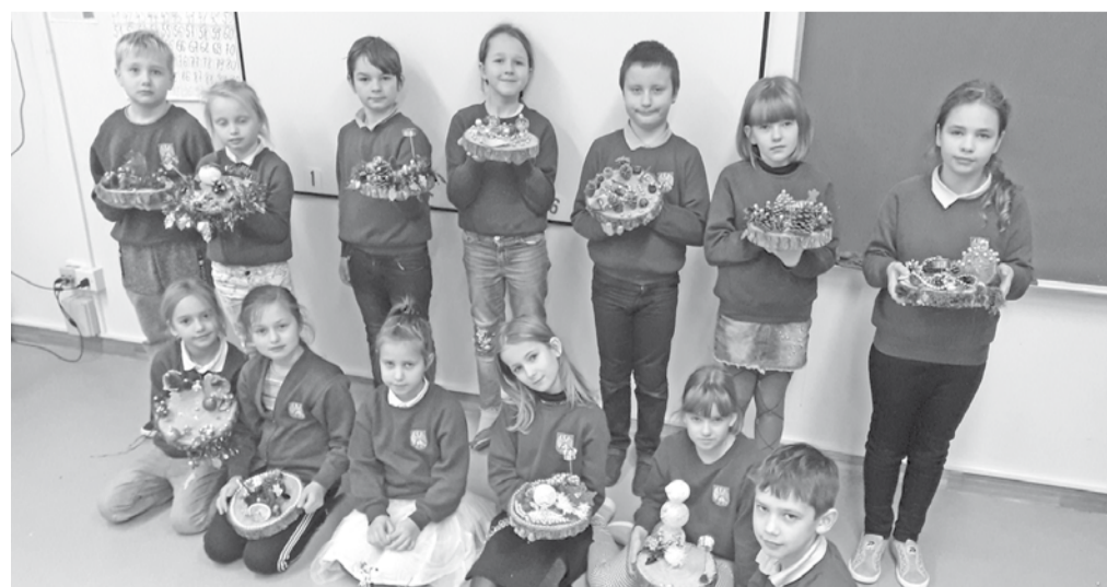
Draudzīgā 2. klase ar saviem darbiņiem.

Mūsu klasē bieži skan bērnu skanīgās balsis, jo tiek ap-