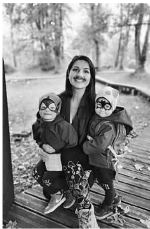
Esam skaisti un priecīgi!