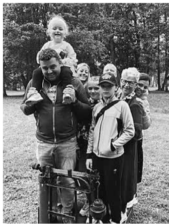
Ģimenes svaram ir liela nozīme.