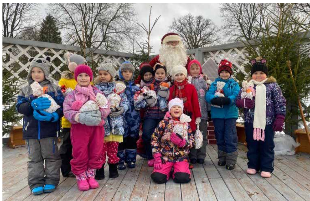
Evitas Lielupes foto

Saposušies izvēlētajās maskās, paņēmuši līdzpaņemto cienu, bērni kopā ar audzinātāju devās uz mežmalu, lai iepriecinātu meža zvērus. Zem eglītes nolikām ābolus, burkānus, bietes zvēru svētku galdam. Atgriežoties iestādes teritorijā, dziedot ķekatu dziesmas, velkot blūķi, devāmies ciemos pie saimnieces, kura mūs gaidīja ar piparkūkām, pīrāgiem un karstu tēju. Dejojām ķekatu dejas, cienājāmies ar gardumiem. Tika iekurts uguns, kurā sadedzinājām visas savas blēņas un nedarbus.