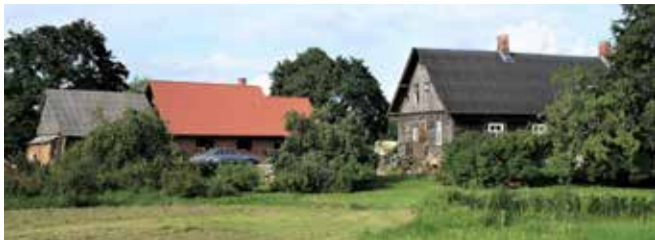
Skats uz „Lejas Āķēnu” saimniecību, 2020. gads.