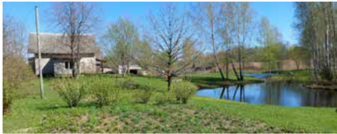
Mājas „Āķēni”, 2021. gads.

Āķēni ir sena vēsturiska vieta, kas 14. gadsimta beigās minēta kā pagasts, 16. gadsimtā – kā Ērgļu pils muižai piederoša teritorija (vēstures avotos ar dažādiem nosaukumiem – Aken, Acken, Aiken, Aikenhoff). 17. gadsimtā karu rezultātā Āķēni stipri cieta, te iekārtoja lopu muižu. 18.gs. pirmajā pusē Āķēnu pusmuižā visas ēkas uzcēla no jauna. Pēc 1832. gada inventarizācijas datiem Āķēnos ir bijusi dzīvojamā māja no koka uz augstiem akmens pamatiem ar dakstiņu jumtu; krodziņš no akmens ar dakstiņu jumtu; klēts no koka uz akmens pamatiem ar salmu jumtu; lopu laidars no koka uz akmens pamatiem ar salmu jumtu un rija no koka ar salmu jumtu. Pusmuižā turēja liellopus, aitas, arī zirgus un cūkas.