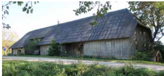
Kādreizējais Brilles krogs, 2020. gads.

Braucot no Jumurdas uz Vējāvu, ceļa malā atrodas kādreizējais Brilles krogs, kas celts 18. gadsimta beigās vai 19. gadsimta sākumā. Tā bija gara guļbaļķu ēka ar milzīgu manteļskursteni, vienā pusē atradās zirgu stadula, otrā – krogs un telpas dzīvošanai, zem ēkas pagrabs. Netālu bija izvietotas saimniecības ēkas, pāri ceļam – rija. Brilles krogs piederēja Veļķu muižai.