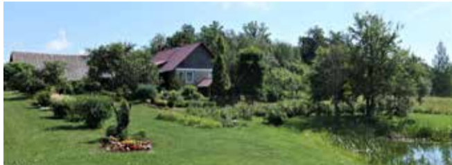
Skats uz „Ūdņēnu” sētu, 2021. gads.

Netālu no Sausnējas, dodoties uz Sidrabīņiem, ir bijušas dzirnavas, kuru pirmsākumi saistīti ar „Ūdņēnu” mājām, kas izveidotas 17.gs. otrajā pusē. Te bijusi avotaina zeme. 18.gs. otrajā pusē „Ūdņēnos” ierīkota Sausnējas muižas lopu pusmuižiņa. 18.gs. beigās un 19. gs. sākumā uzcelta dzirnavu mūra ēka. Lai darbinātu dzirnavas, ūdeni uzpludināja no spēcīga avota. Netālu atradās rija, kūts, klēts.