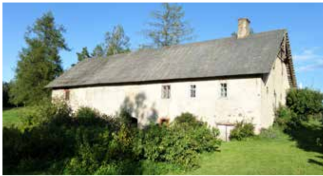
Mājas „Dzirnavas”, 2020. gads.