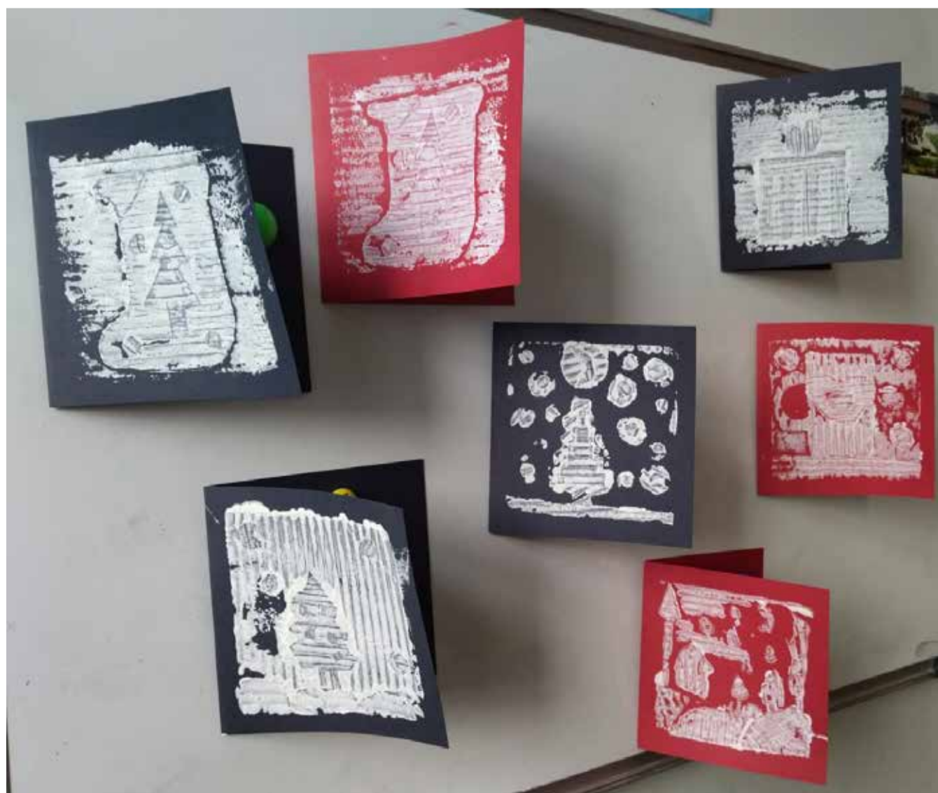
8. klases skolēnu kopdarbs.