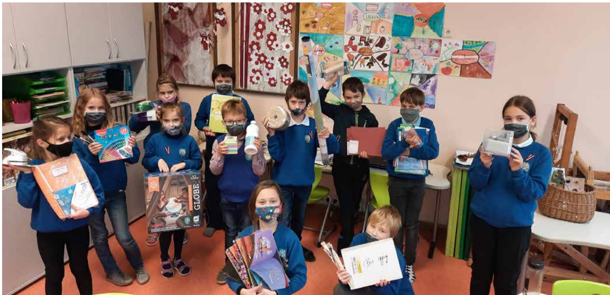
3. klase ar darba materiāliem.