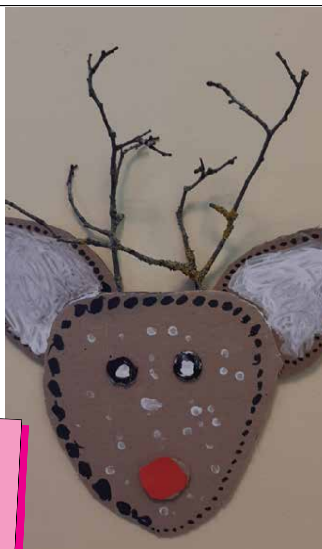
1. klases darbs.