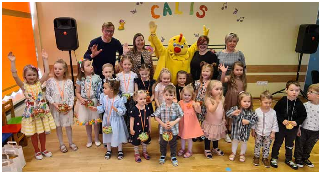
"Ērgļu Cālis 2022" dalībnieki.

Pēc divu gadu pārtraukuma pirmsskolas izglītības iestādē "Pienenīte" norisinājās mazo vokālistu konkurss "Cālis-2022". Priecīgs satraukums gan maziem, gan lieliem. Ar skaņīgu dziedājumu mūs iepriecināja 19 mazie vokālisti. Gatavošanos uzsākām laicīgi, dodot iespēju visiem iestādes bērniem mūzikas nodarbību laikā vingrināties dziedāt individuāli pie mikrofona paša izvēlētu dziesmiņu atbilstoši spējām. Nedēļu iepriekš katrā grupā norisinājās atlasē konkurss. Dziedājām, uzstājāmies un mazu motivācijas dāvanīņu saņēmām visi. Šajā atlasē noskaidrojām arī skanīgākos dziedātājus, kurus izvirzījām iestādes konkursam.