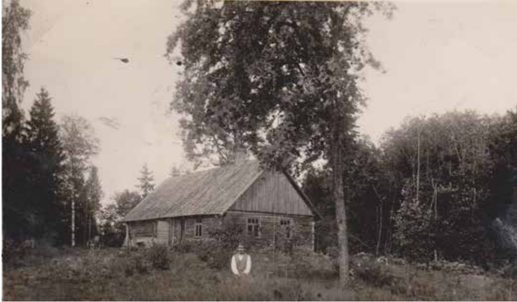
Mājas „Tērmūtnes”, priekšplānā Jēkabs Elsters, 1930. gadi.