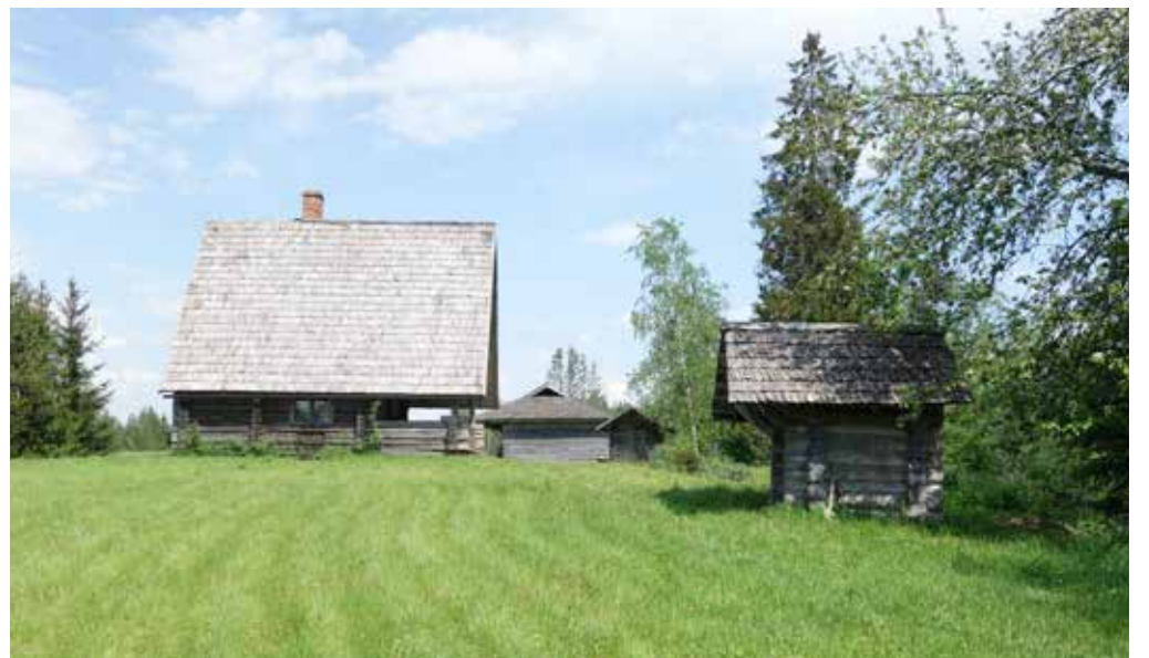
Atpūtas vieta „Trijupeš”, 2020. gads.