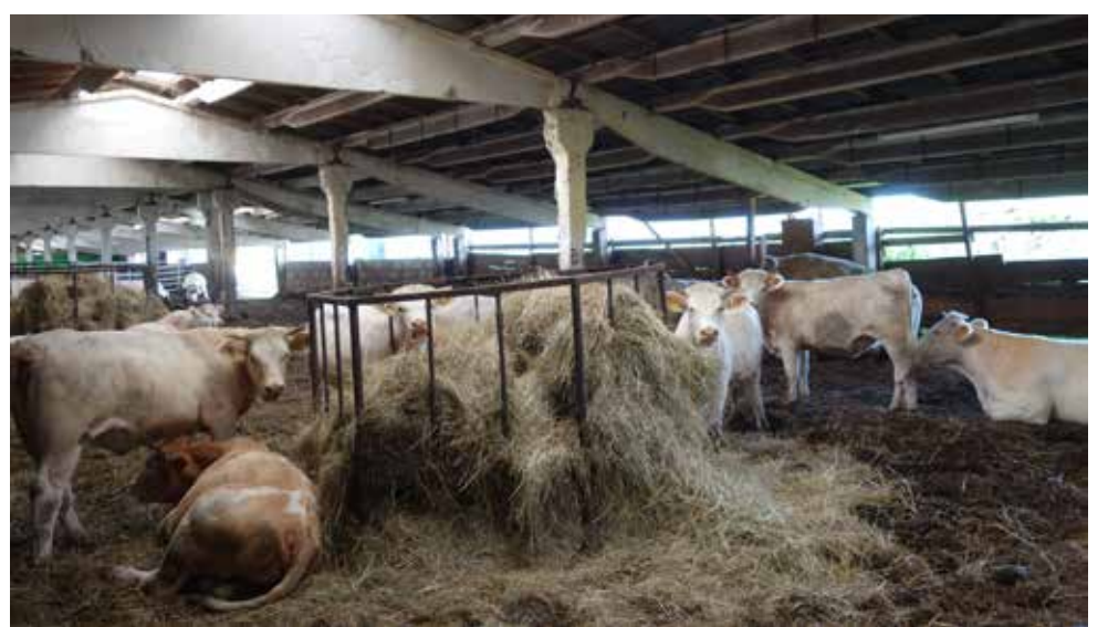
Saimniecības liellopi, 2020. gads.

Meža viesus uzskatot, saimniecei ātri bijis skaidrs darāmais. Atvērusi logu, tā uz karstām pēdām likusi viņiem bēgt stāvajā pakrastē un pati ķērusies pie lupatas. Tiklīdz pēdas bija nokoptas,