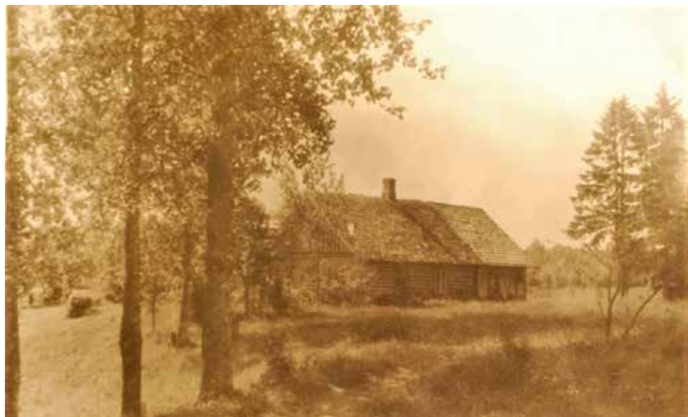
Mājas „Trijupeš”, 1950./1960. gadi.

Materiālu apkopēja Zinta Saulīte, „Braku” muzeja vadītāja