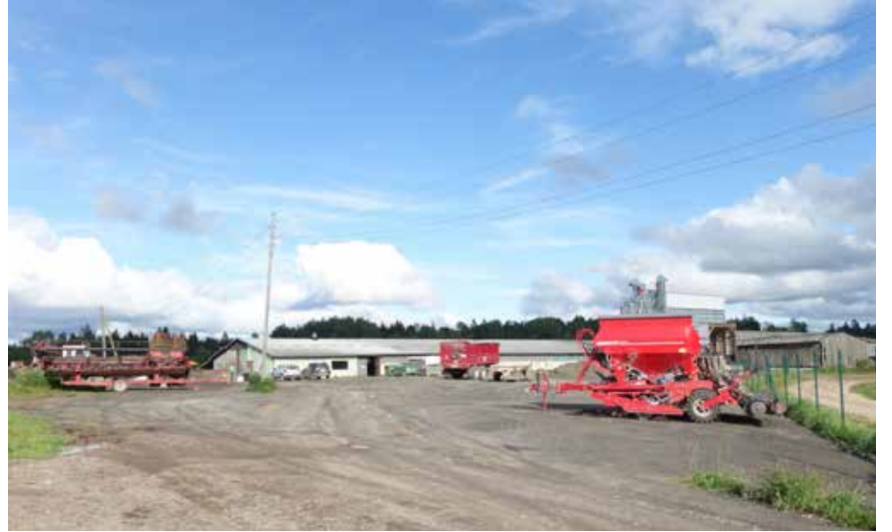
Saimniecības „Tauri” lopu novietne un graudu kalte, 2020. gads.