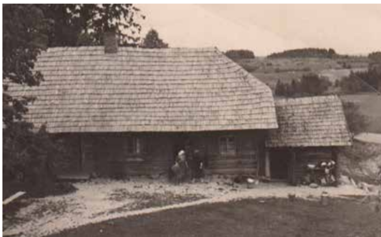
„Braku” dzīvojamā māja, 1930. gadi.