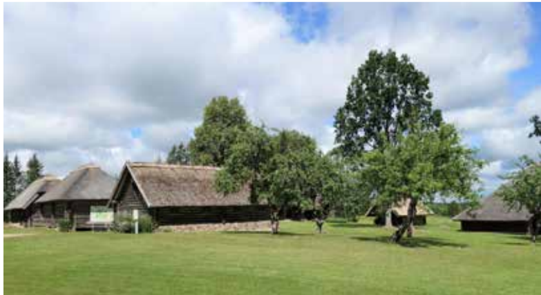
Skats uz „Brakiem”, 2022. gads.