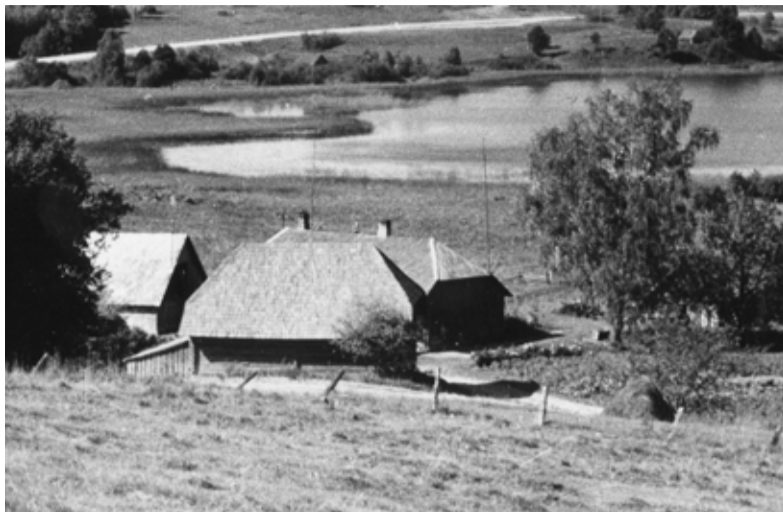
„Meņģeļu” ēkas un Aķēnu ezers, 1970. gadi.

Muzejs jau daudzus gadus popularizē Rūdolfa Blaumaņa personību un daiļradi, rūpējas par „Braku” teritorijas sakopšanu, lai apmeklētāji izbaudītu latviešu senatnes lauku sētu, izstaigātu takas un sajustu dabas skaistumu un burvību.