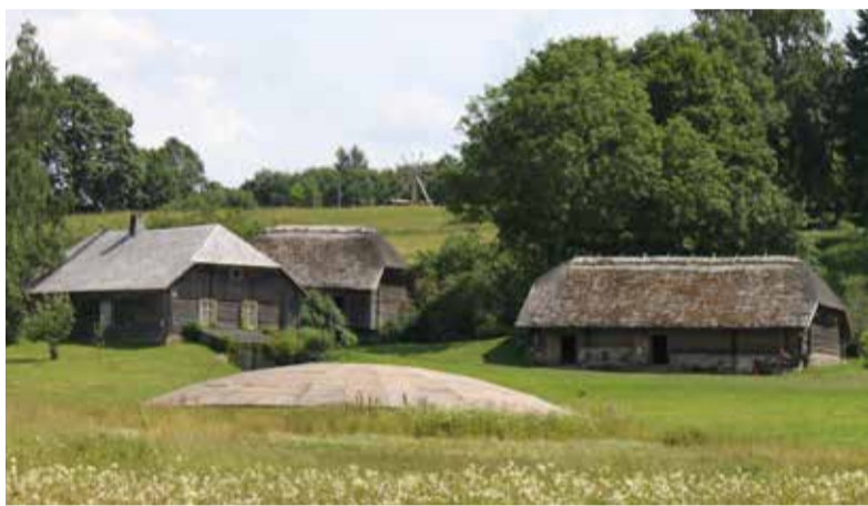
Skats uz „Meņģeļiem”, 2014. gads.