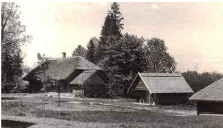
Dzīvojamā māja, klēts un rijas stūris, 1963. gads.