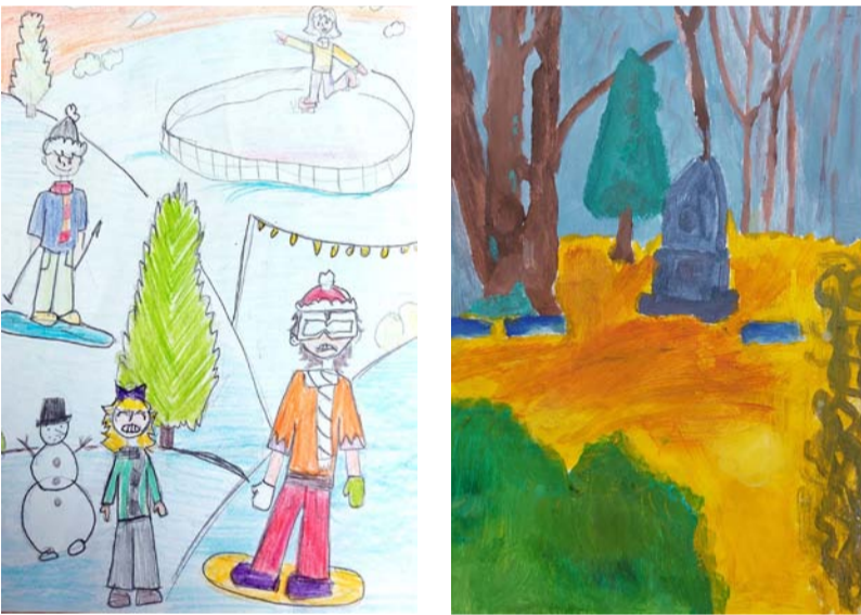
Undine Ceplīte 5. kl.