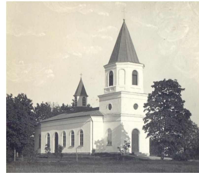
Ērgļu pareizticīgo baznīca, 1920. gadi.