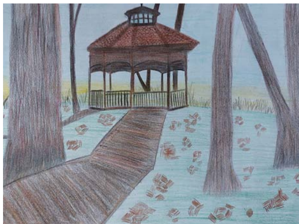
Lelde Liepiņa 10. kl.