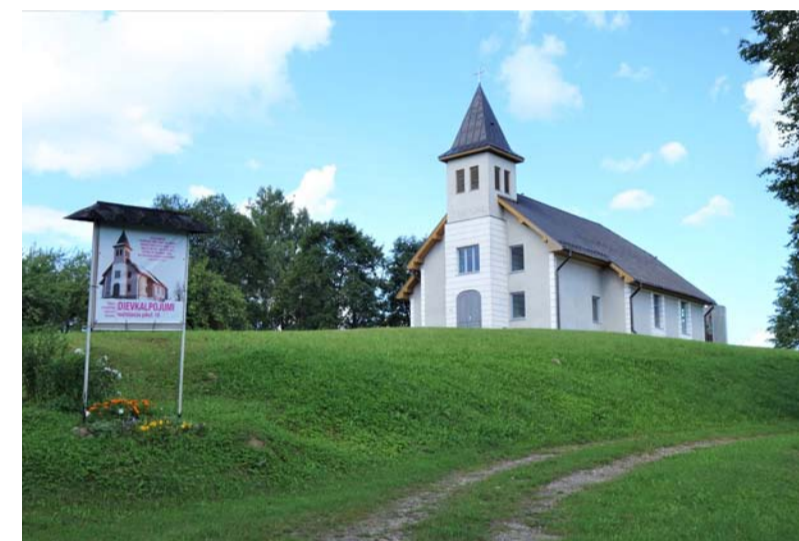
Ērgļu luterāņu baznīca, 2022. gads.

1989. gada 12. februārī tika atjaunota Ērgļu luteriskās draudzes darbība, dievkalpojumi notika Ērgļu kultūras nama telpās. 1995. gada 3. februārī draudze pieņēma lēmumu par baznīcas celtniecību. Vieta tika izvēlēta Piebalgas ielā 3. 1996. gada 29. jūnijā prāvests Viesturs Vāvere un mācītājs Jānis Šmits luterāņu draudzei pieder-