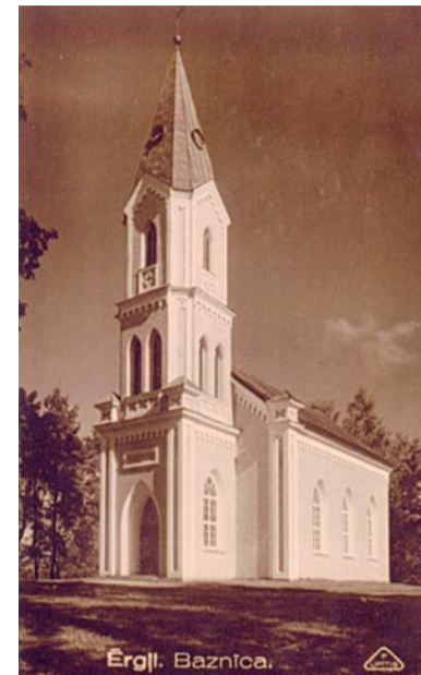
Ērgļu luterāņu baznīca, 1937. gads.