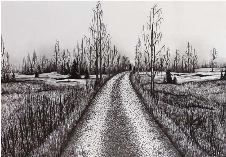
Signe Solovjova 12. kl. Vecais Ērgļu dzelzceļš.

Uz tālākiem kopīgiem piedzīvojumiem! Samanta , 10. klases skolniece