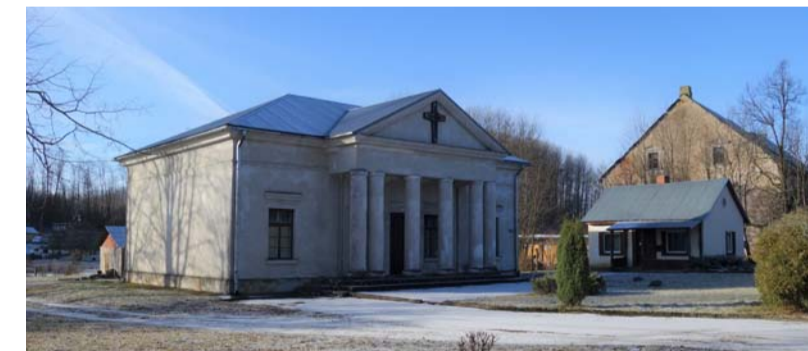
Ērgļu katoļu baznīca, 2020. gads.

19.gs. vidū daudzi sausnējišķi pārkristījās pareizticībā. Sākumā