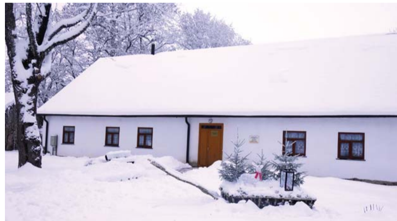
Sausnējas Baltā māja – rakstnieka Valda muzejs ziemas baltumā.

Pēc koncerta uzrunāju dažus tā apmeklētājus, lai uzklaustu viņu pārdomas par šo pasākumu un arī atskatītos uz savām gaitām dejas mākslas pasaulē.