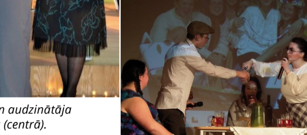
12. klase iejutusies „Limuzīns Jāņu nakts krāsā” tēlos.

notikumos. Pēc svinīgās vakara daļas sāstā stīpo un gudro ērgļa simbolu. Un tad jau bija pienācis laiks, lai saviem visiem sniegtu ieskatu arī tajos trakajos, radošajos, azartiskajos un nedaudz smieklīgos