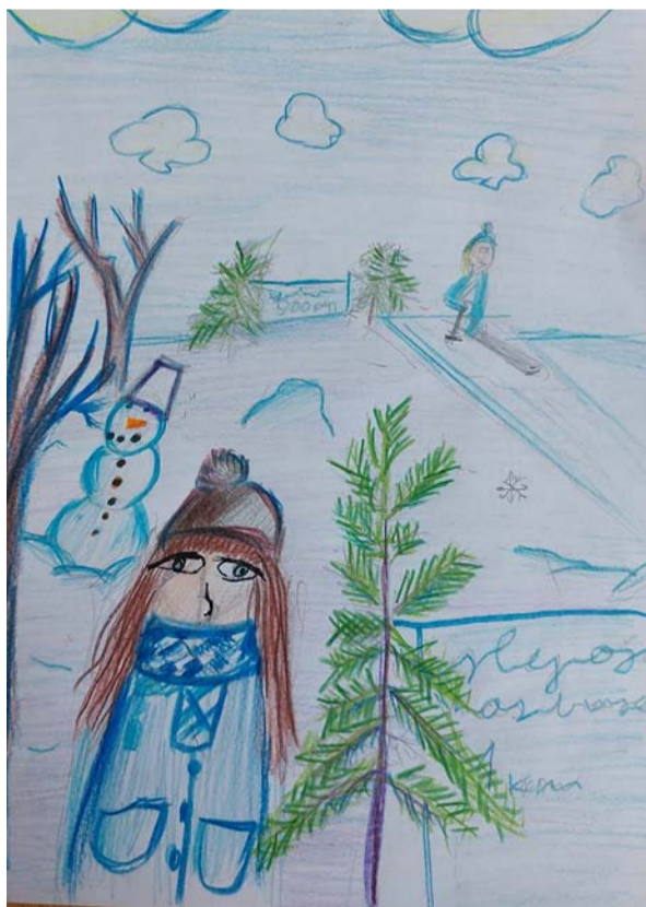
Adriāns Alksnis 5. kl.

Uz tik drīzu neatvadišanos – Tava Alīna , 10. klases skolniece