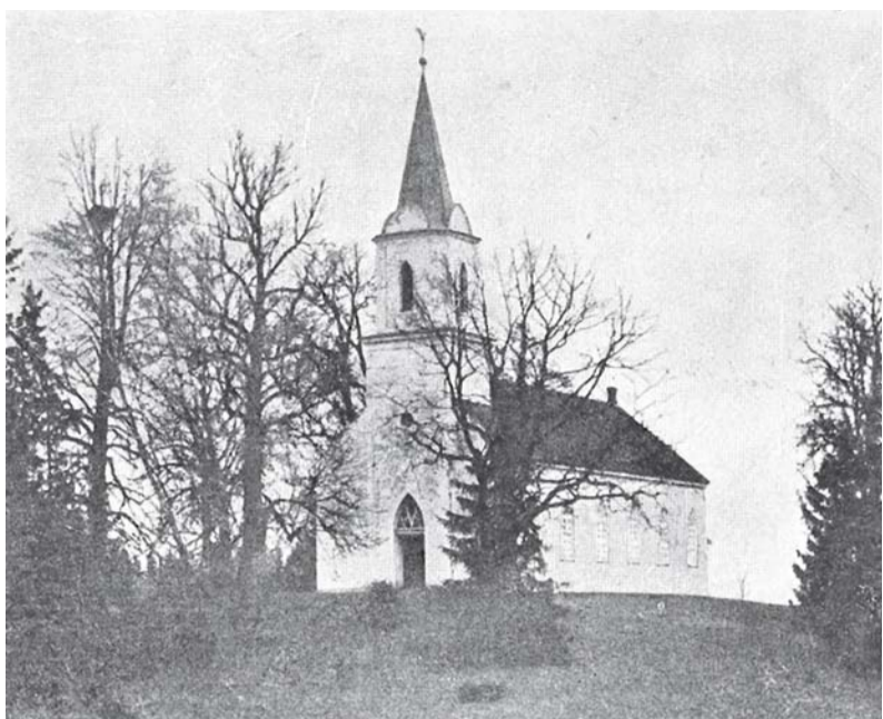
Liepkalnes luterāņu baznīca, 1930. gadi.