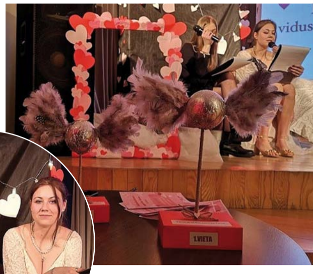
Priekšplānā – Skolēnu domes gatavotā balva „Ērgļu Sudraba Spārni”.