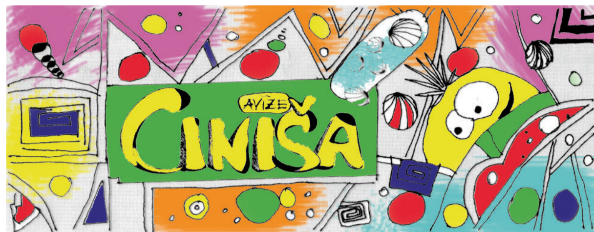
Skolas literārā avīze

Kā jau mēs visi, arī es sāku savu izglītības ceļu ar sākumskolu, kas bija aizraujošs un jautrības pilns posms manā dzīvē. Es biju zinātkāra un vēlējās apgūt jaunus lietas. Man patika atklāt, kā darbojas apkārtējā pasaule. Sākumskolā mēs apguvām lasīšanas, rakstīšanas un rēķināšanas prasmes, kas kalpoja par pa-