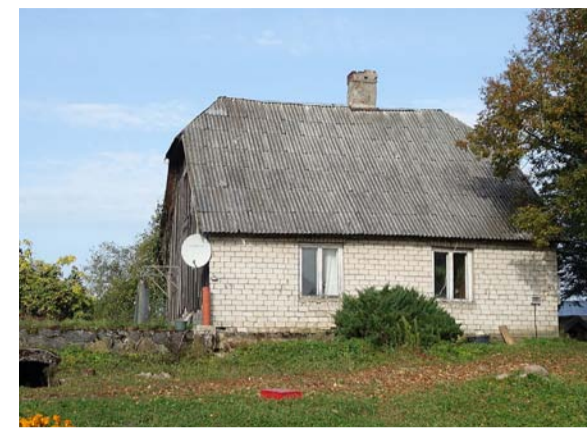
Mājas „Ramulēni”, 2020. gads.