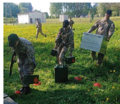
Militārās stafetes komanda darbībā.