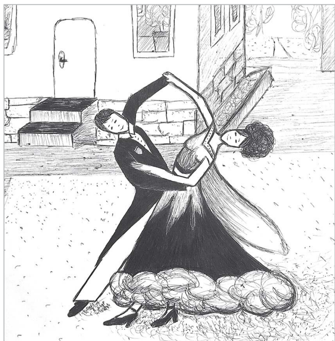
Samanta Liepiņa 5. kurss