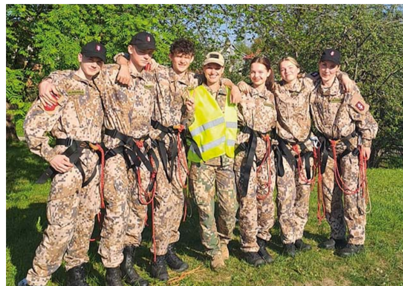
Ērgļu jaunsargu tūrisma komanda

Šogad jaunsardzes slidojums jeb sporta spēles norisinājās pie mums, Ērgļos, 20. un 21. maijā. Tas ir viens no lielākajiem jaunsardzes pasākumiem. Tajā piedalījās komandas no visas Latvijas, un sacensības notika visu novadu sastāvā. Katrs novads, izveidojot komandu vai piesakot no jaunsardžiem sportistu noteiktajā sporta veidā, varēja piedalīties šajā pasākumā.