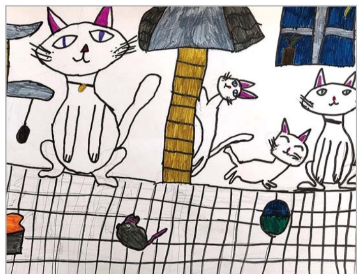
Elizabete Kļaviņa 1. kurss