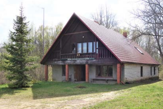
Mājas „Brīvuļi”, 2023. gads.