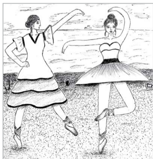
Anna Ludborža 5. kurss