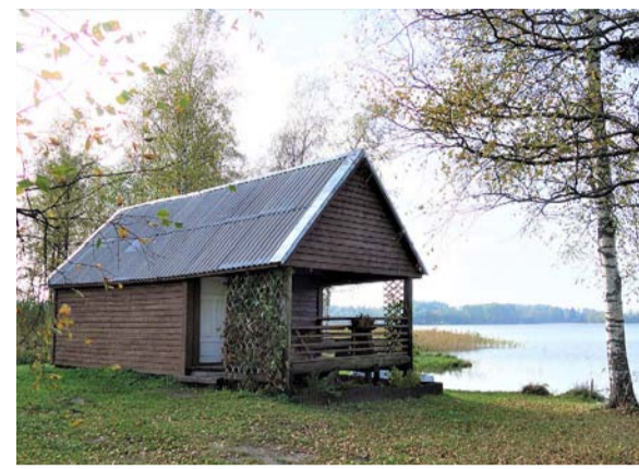
Atpūtas vieta pie Pulgošņa ezera, 2020. gads.