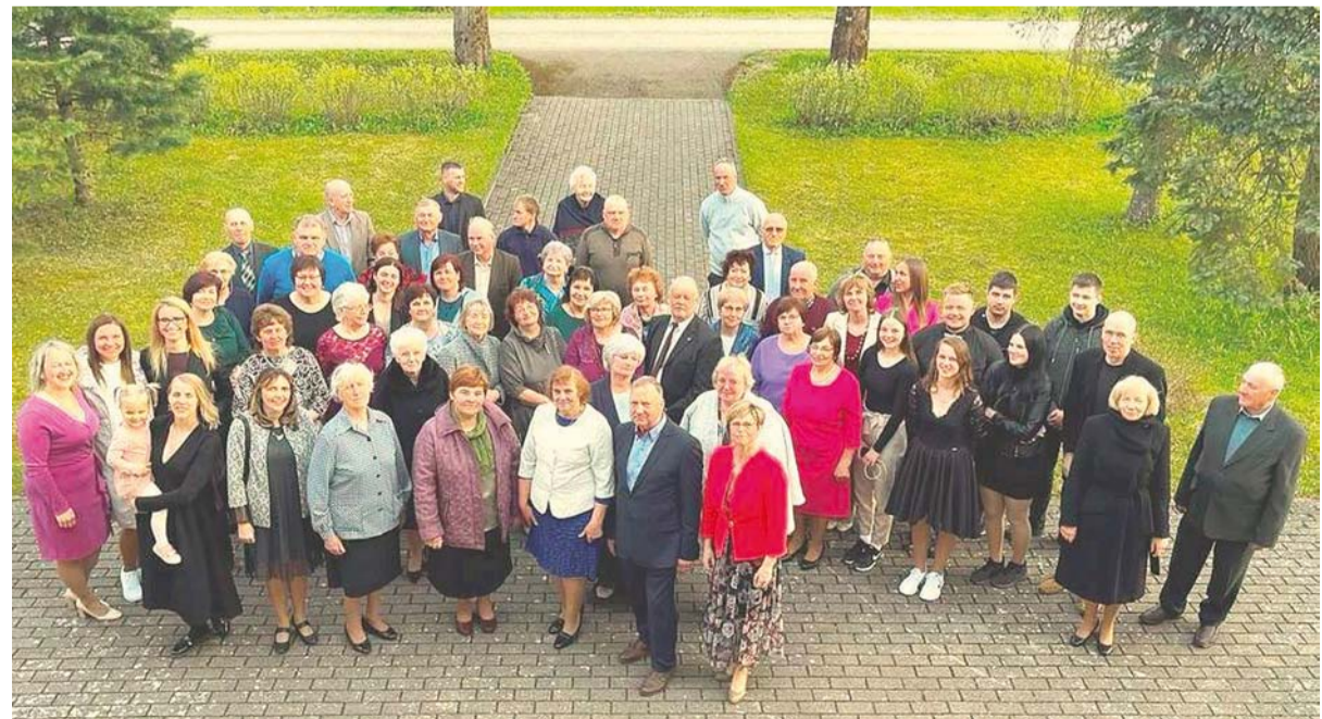
Paauzdu tikšanās pasākuma dalībnieki Sausnējas skolas pagalmā 2023. gada 5. maijā.