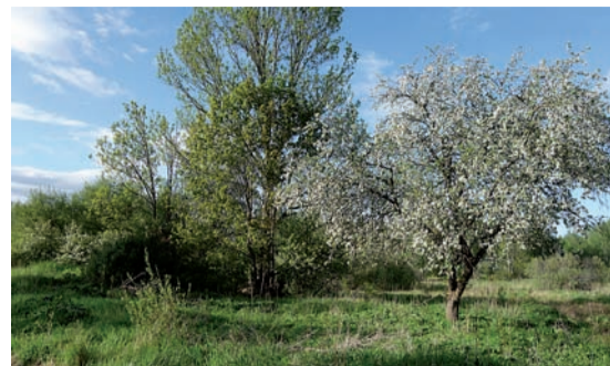
Kur bijuši Vitoliņu „Baltklāvi”, palikušas drupas un koki, 2020. gads.

Pļaviņi tika izkaisīti pa dažādām vietām – gan Latvijā, gan ārzemēs. Savas dzimtas mājas viņi