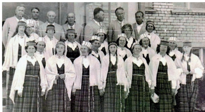
Sausnējas jauktā kora dalībnieki Rīgā 1973. gada Dziesmu un deju svētku laikā.