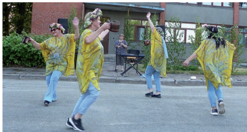
Uzstājas Sausnējas pagasta līnijdeju grupa „Dzīvojam dejā!”.