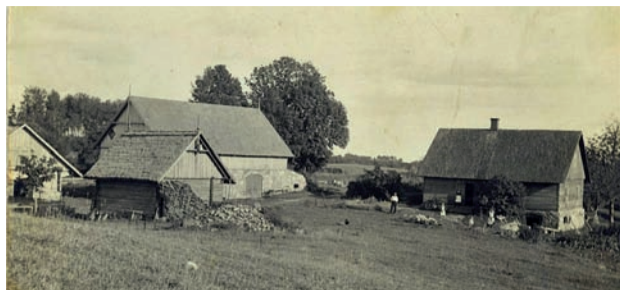
Skats uz Svikliņu „Baltklāvu” sētu, 1930. gadi.