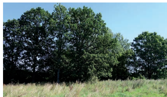
Varenie ozoli – liecinieki par Ozolu „Baltklāviem”, 2020. gads.