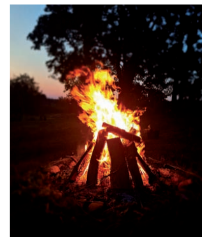
Ieva Vilnīte, Brāļu Jurjānu muzeja „Meņģeļi” vadītāja

Novēlu ikvienam uz brīdi apstāties, pavērties apkārt un ieklausīties dabā.