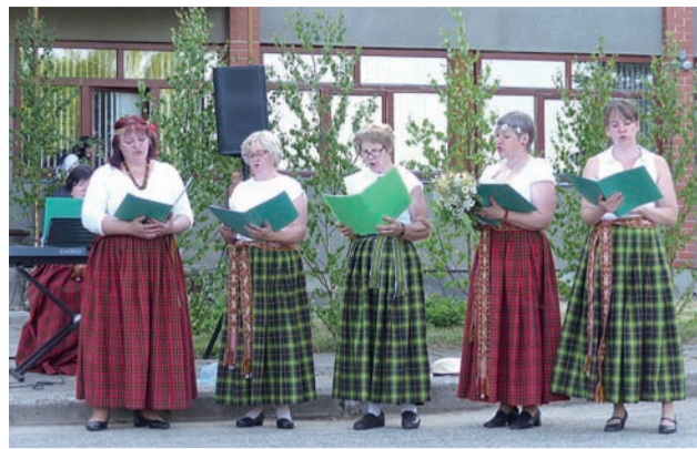
Dzied Vietalvas pagasta sieviešu vokālais ansamblis.