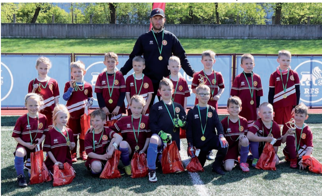
Futbolisti sacensībās.

Ērgļu mazajiem futbolistiem pavasarī bija svarīgs notikums. Madonas novada pašvaldības dome 27. aprīlī nolēma piešķirt