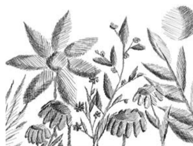
Paula Simona Spaile, 5. kurss