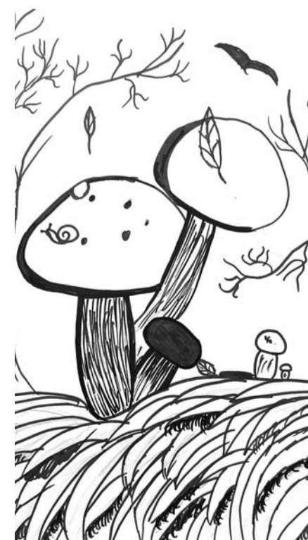
Viktorija Ieva Rutka, 2. kurss