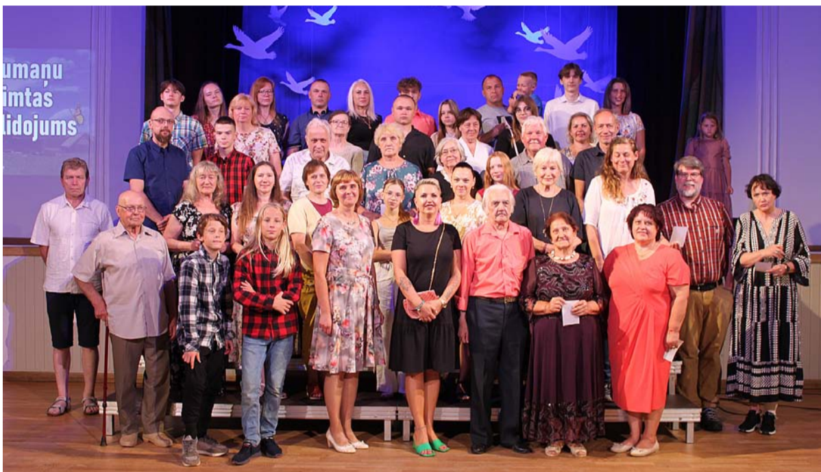
Blaumaņu dzimtas 4. salidojuma dalībnieki.