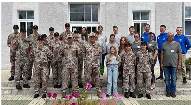
Nometnes dalībnieki un vadītāji.

Kad lidostā bija sagaidīti vācu jaunie ugunsdzēsēji, devāmies uz Ērgļiem, lai kopā piedzīvotu varen jautru nedēļu. Svinīgi atklājām nometni, spēlējot orķestrim. Nedēļas laikā bija daudz un dažādu aktivitāšu komandu sastāvā – disku golfs, orientēšanās pa Ērgļiem un skolu, nodarbības sporta zālē, apgleznojām arī krekliņus un izveidojām savus māla trauciņus. Vakaros meiteņu un zēnu istabās varēja dzirdēt čalošanu un smieklus, jo savā starpā dalījāmies ar informāciju, ko darām ār-