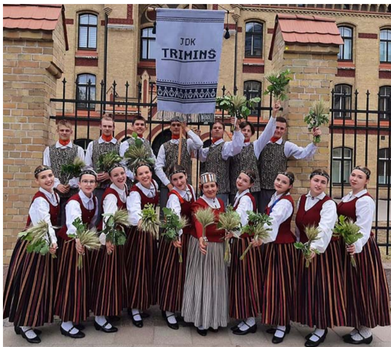
Nogurušais, bet laimīgais „Trimīnš” pēc gājiena.

1. jūlija vakarā mēs devāmies uz Rīgas Valsts 1. ģimnāziju, lai gatavotos nākamā rīta svētku dalībnieku gājienam „Novadu dižošanās”. Gājiens bija satricēoši skaists un tajā pašā laikā arī nogurdinošs. Ejoj gājienā, redzējām daudz svešu un arī dažas pazīstamas sejas. Bija prieks redzēt tik daudz cilvē-