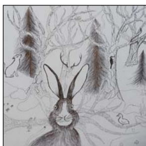
Evelīna Kļaviņa, ĒMMS 5.k