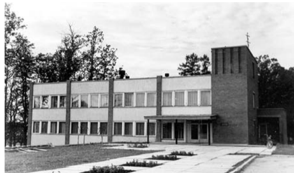
Kolhoza „Jaunais darbs” kantoris, 1980. gadi.