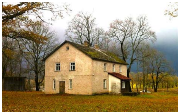
„Kalna lelejas”, 2016. gads.