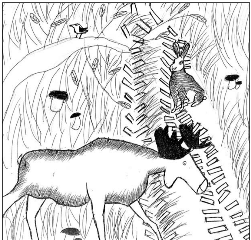
Elizabete Kļaviņa, ĒMMS 2. kurss