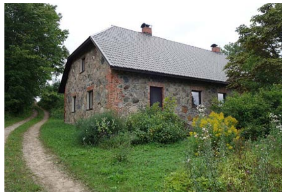
Mājas „Vecvaguļi”, 2022. gads.

Sausnējas pagasta Sidrabiņu centrā agrāk bijusi Ozolmuiža, kuras pirmsākumi saistīti ar 17. gadsimta sākumu. Par Šiltenu jeb