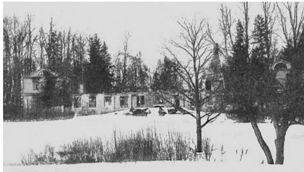
Ozolmuižas nodedzinātās kungu mājas fasādes skats, 1905. gads.