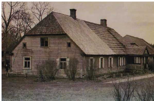
Vējavas skola, 1950./1960. gadi.

Kara laikā smagi cieta Vējava un arī kādreizējās muižas ēkas. Daļēji bija saglabājusies viena no kungu mājām, kurā, veicot remontdarbus, 1947. gadā iekārtoja Vējavas septiņgadīgo skolu. Ēkā atradās mācību telpas, skolotāju istaba, virtuve, internāts, arī nelieli dzīvokļi skolotājiem. Skola bija gaiša, mājīga, ar lieliem logiem. Netālu atradās sporta laukums, parks, kurā auga veci koki. Ik rudenī bija daudz darba, lai grābtu