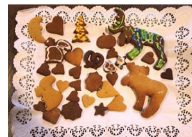
Mūsu skaistās, smaržīgās un garšīgās piparkūciņas!

Pētot eglīšu rotājumu vēsturi, nolēmu aicināt pagasta cilvēkus pārskatīt savās mājās esošos rotājumus ar senatnīguma pieskaņu, atlasīt interesantākos, neparastākos, ievēribas cienīgākos, lai piedalītos egļīšu rotājumu izstādē . Izstāde bija aplūkojama