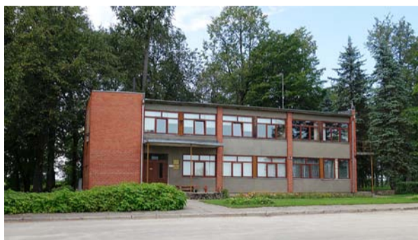
Sausnējas pagasta pārvaldes ēka, 2019. gads.

lapas un sakoptu teritoriju. Ar laiku skolēnu skaits samazinājās, un mācību iestāde tika reorganizēta par četrklasīgo skolu, bet 1964. gadā – slēgta. 1960. gadu otrā pusē skolas ēkā iekārtoja LVU Ģeogrāfijas fakultātes stacionāru, kur studenti veica kompleksos pētījumus.