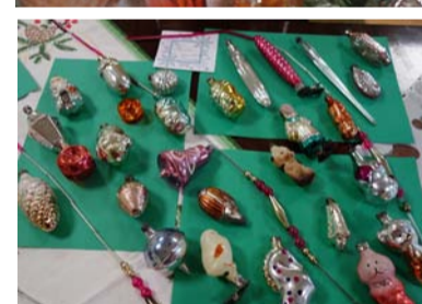
leskats eglīšu rotājumu izstādē.