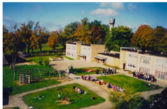
Skats uz b/n „Zīļuks”, 2000. gadu sākums.

Kungu mājas priekšā bija izrakts dīķis, ko iesauca par Daugaviņu, tajā muižnieki vizinājušies ar laivām. Krasti skaisti sakopti. Daugaviņā bija iekārtota peldētava ar ozolkoka dēļu grīdu. Uz peldētavu vedis paaugstināts celiņš ar koka margām. Muižā bija sava putnu māja, kas bija veidota ar skaistiem koka izgriezumiem. Vistas nāca ārā pa trepītēm. Apkārta bija sēta. Aukstā laikā putnu māju kurināja. Uz ceļa Sausnēja–Liepkalne pusi, kur krustojums, bija smēde. Tālāk šķūnis, ko sauca par mironšķūni, jo parasti te neilgu laiku periodu glabāja kādu mirušu muižas cilvēku, līdz aizveda uz kapiem. Šķūnī stāvēja kuļmašīnas.