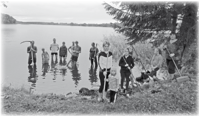
Peldvietas sakopšanas talka 2012. gada jūlijā.

Atsaucoties uz Izglītības un zinātnes ministrijas septembrī izsludināto konkursu, interešu grupa „JUMaliņa” arī aizpildīja pieteikumu un pieteica konkursam „Brīvprātīgais – 2012” savu iniciatīvu „Jumurdas pagasta publiskās peldvietas sakopšanas talku”. Pavisam konkursa gaitā savus pieteikumus iesūtīja 47 jauniešu komandas no visas Latvijas, kuras sadarībā ar pašvaldībām, bibliotēkām, jauniešu