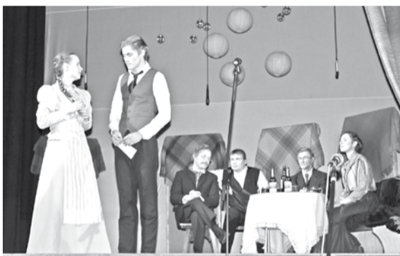
Skats no izrādes