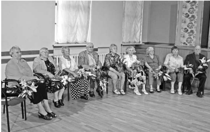
Atļauj šodien saviem gadiem ziedēt kā ziedlapiņām, kuras saulē plaukst, atļauj šodien saviem gadiem skanēt kā melodijai, kura sirdi šalc.