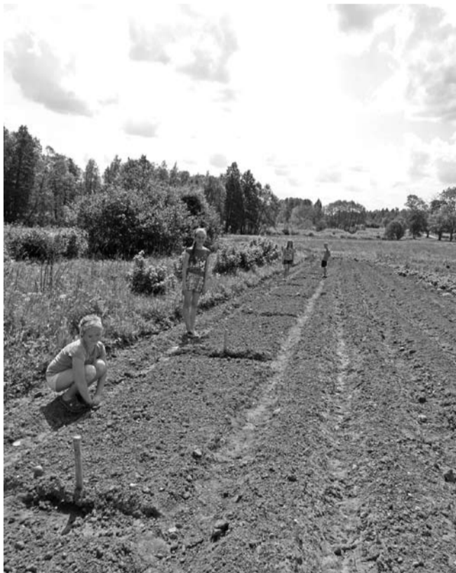
JUMaliņu” jaunais izaicinājums!