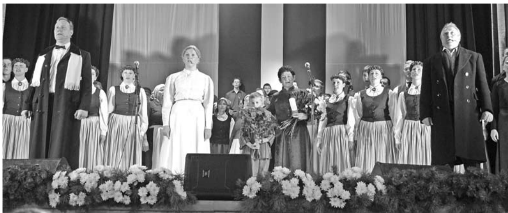
Skats no uzveduma.