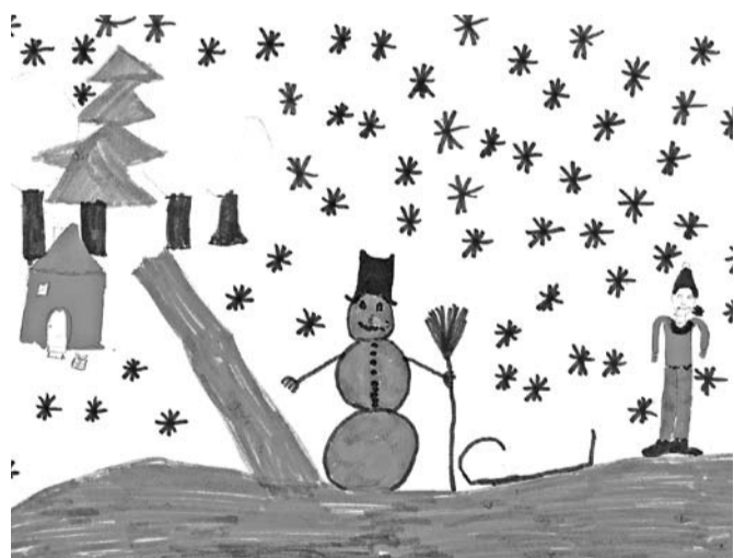
Elīna Veicmane , Sausnējas pamatskolas 5. kl.

Ziemīši vairs nav aiz kalniem. Ielas vidū Esam Mēs. Aši ņemam sniega pikas, Sākam visus appikot!