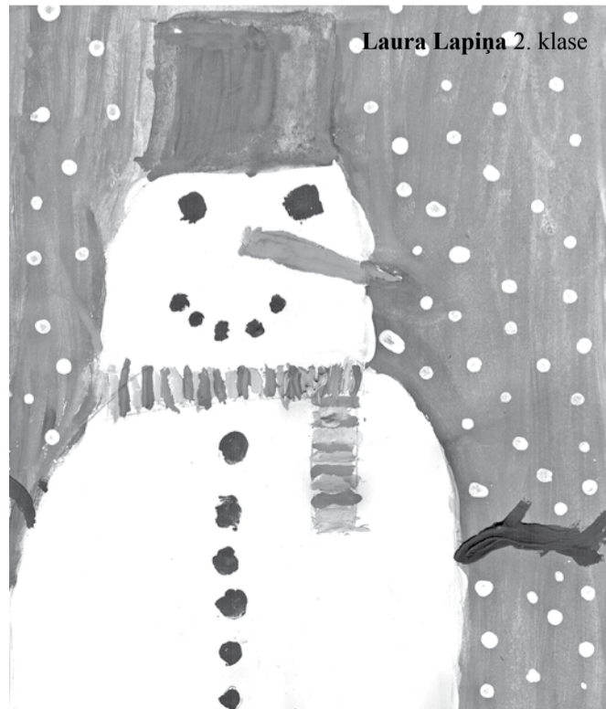
Laura Lapīņa 2. klase