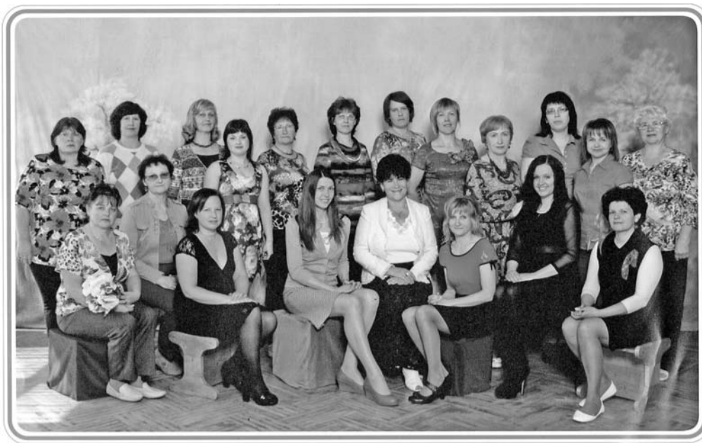
Ērgļu p.i. "Pienenīte" 2013./2014. mācību gads