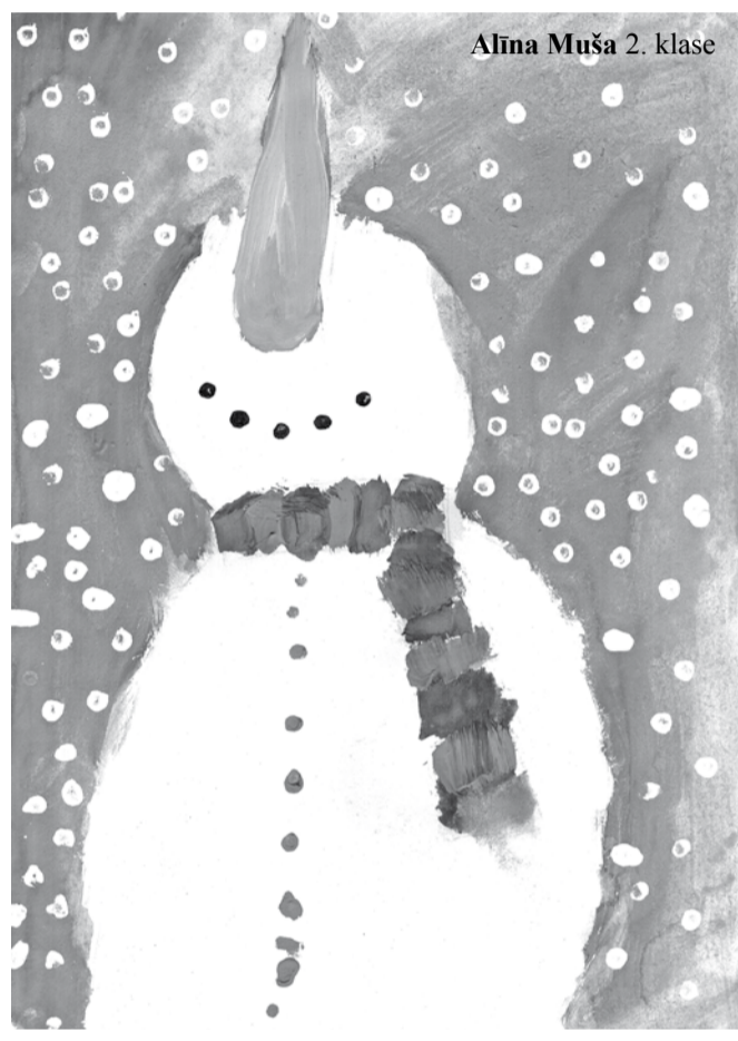
Alina Muša 2. klase